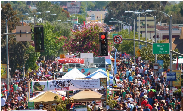
フォールブルック・アボカド祭り

アスパラガスを使った食べ物といえば、ベーコン巻きやアスパラガスのフライ、アスパラガス・ソフトクリームもあります！クラフトビール人気のおかげで、祭りで提供されるビールの種類も多いです。暑くなるかもしれないので帽子をお忘れなく！