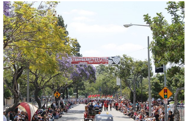
ガーデン・グローヴ・パレード

パソロブレス・ワイン祭り(5月16日～19日)はカリフォルニア州セントラルコースト近くで行われる最大の屋外ワイン祭りかもしれません。21歳以上の方しか参加できないので、子ども連れでの参加はできません。参加者はこの4日間、毎日別のことを体験できます。様々なレストランで晩ご飯を試食することができる日もあれば、また別の日には、今後販売予定のワインを飲むことができます。土曜日の朝にワイン醸造セミナーに参加することもできます。ワイン祭りは広いので、帽子と日焼け止めを持って行かれた方がいいと思いますし、即席ピクニックのために折り畳み椅子も持って行かれた方がいいかもしれません！