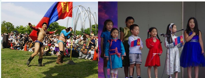
モンゴル相撲“ブフ”

私も以前2回ほどこの祭りに参加したことがあり、大空の下で大勢の友達と大いに楽しむことができた楽しい祭りでした。